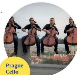
Prague Cello Quartet